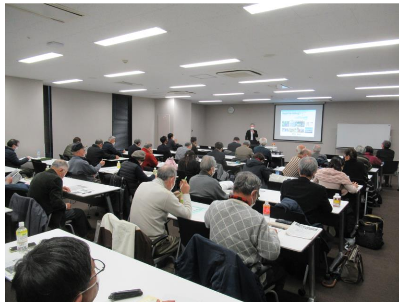
第2回 2月10日 ウィンクあいち