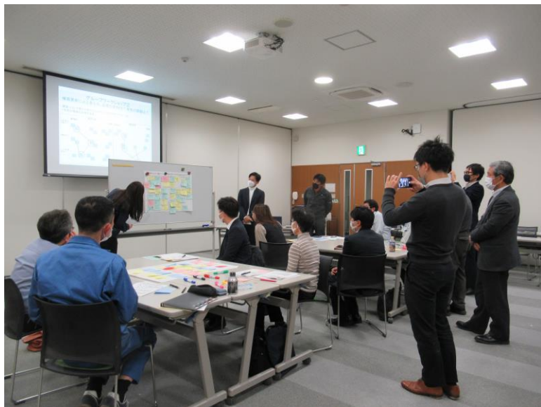
12月19日省エネセミナー