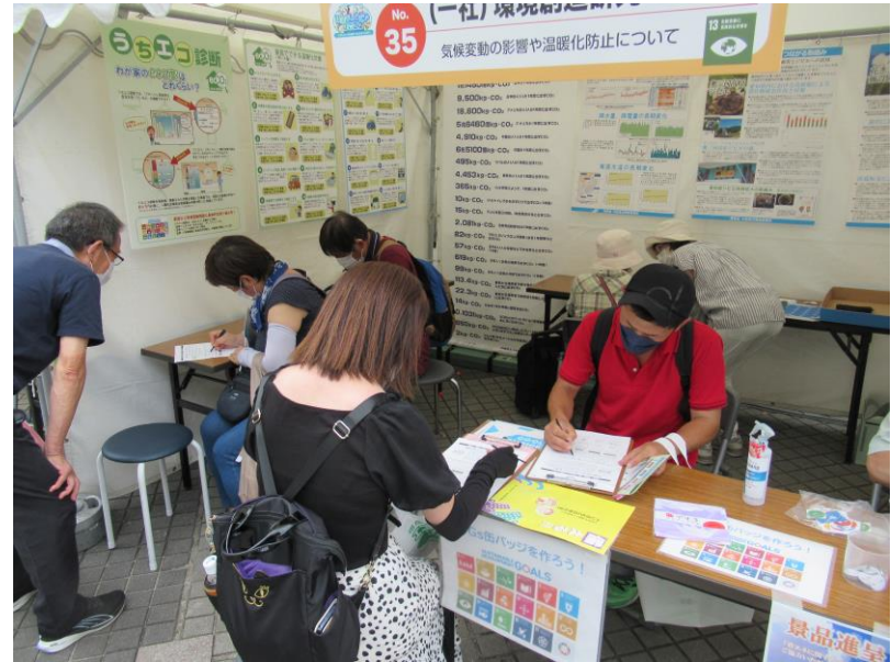
9月17日 環境デーなごや (久屋大通公園)