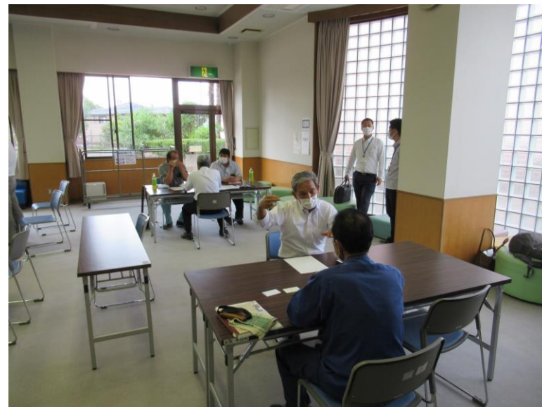
8月23日省エネ個別相談会