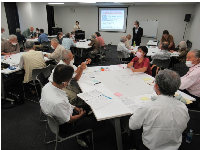
第1回 9月29日 ウィンクあいち