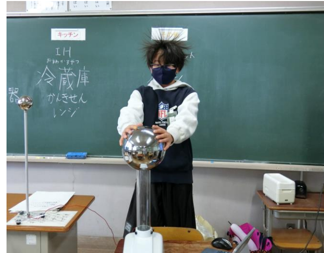
バンデグラフによる髪の毛逆立ち実験