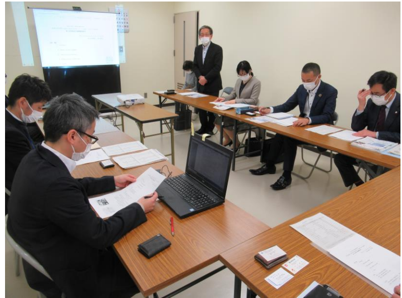
第2回 2月10日 ウィンクあいち