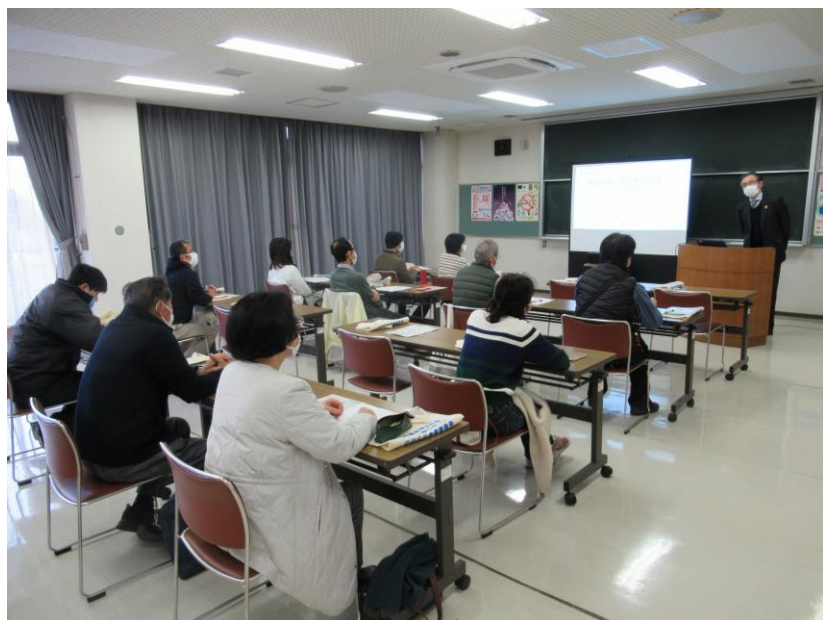
第3回エコライフセミナー 10月31日