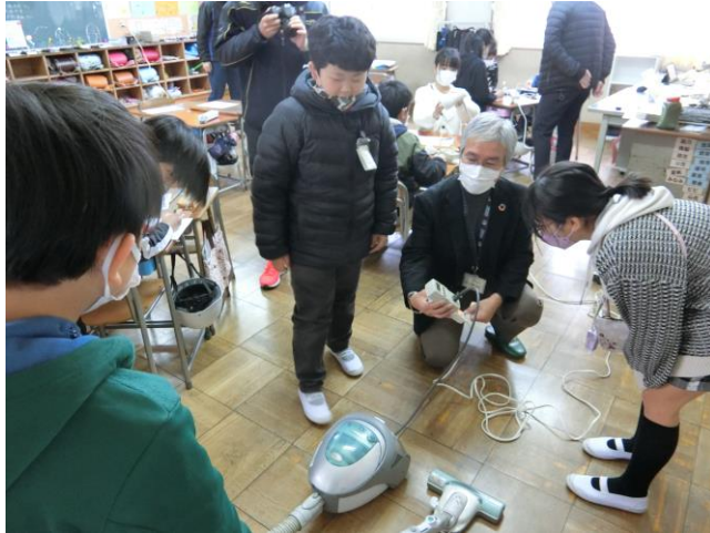
消費電力量の測定