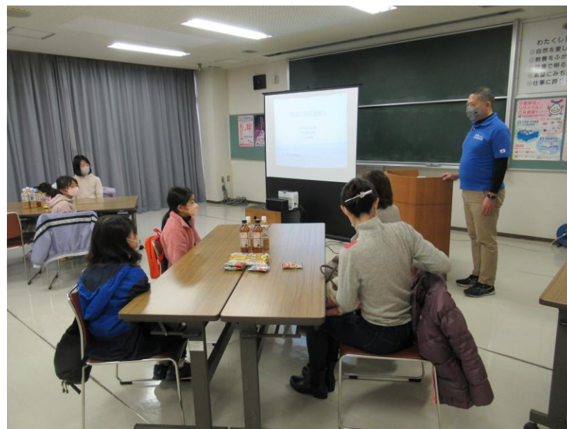
親子環境カフェ 1月14日