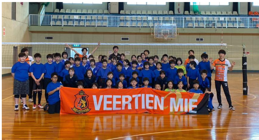
ヴィアティン三重選手による バレーボール技術指導