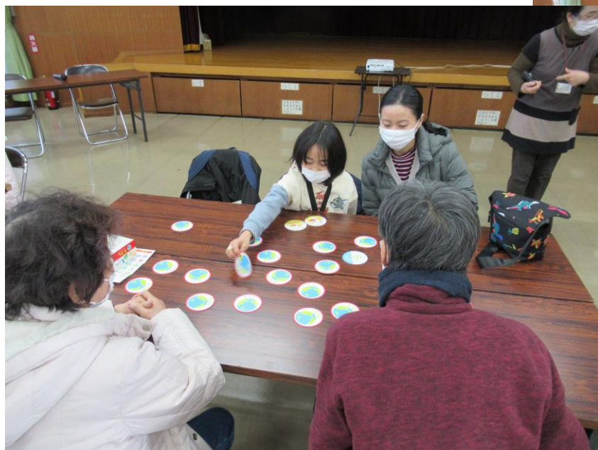
家族でエコレカードゲーム