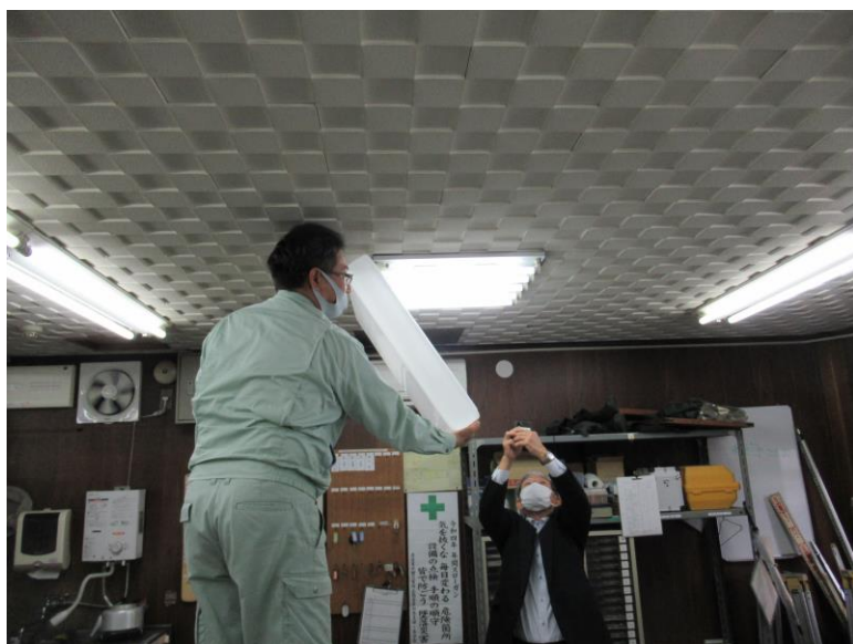
11月28日 某企業での省エネ診断