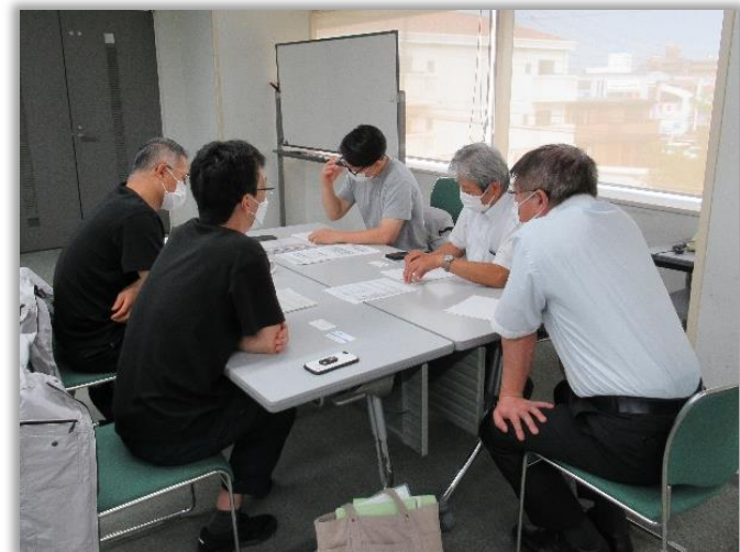
企業向け個別相談会