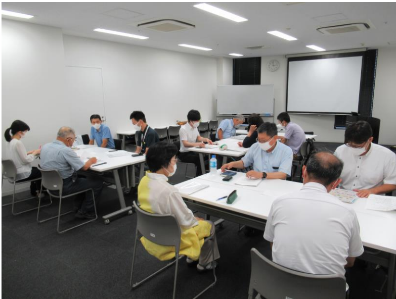
第1回 7月26日 ウィンクあいち