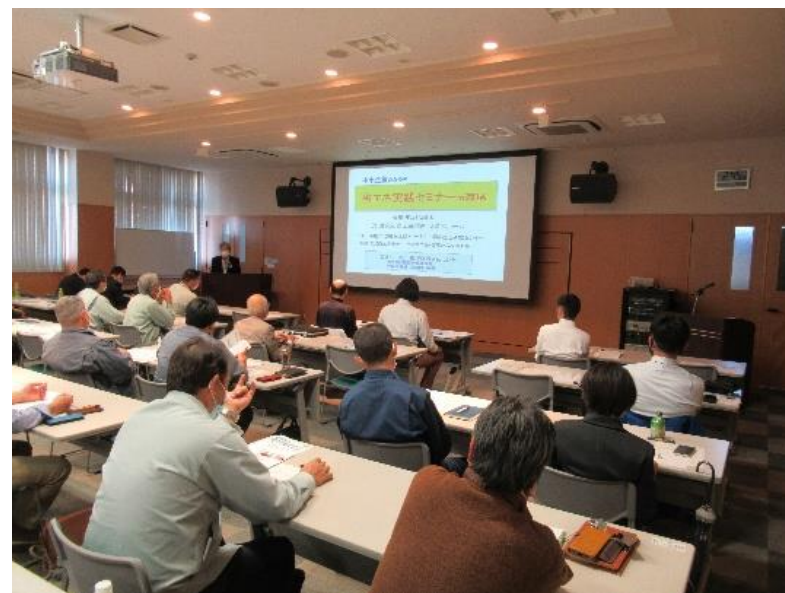
11月2日西尾市内での中小企業実践セミナー