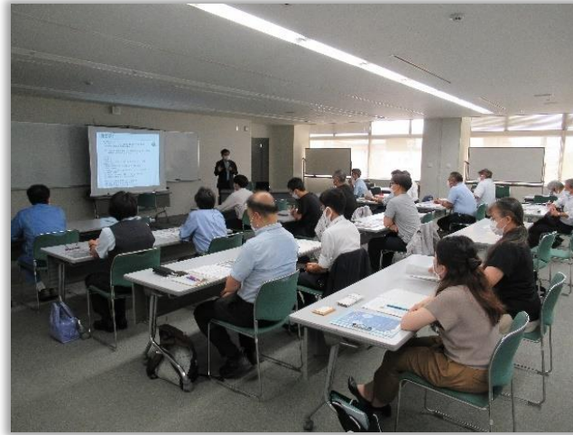
中小企業向けセミナー