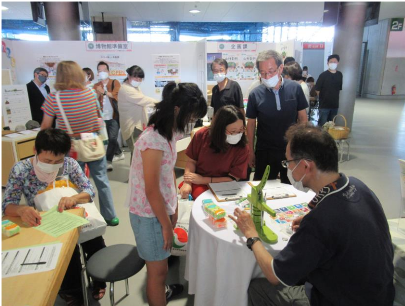
9月10・11日 とよた産業フェスタ (豊田スタジアム)