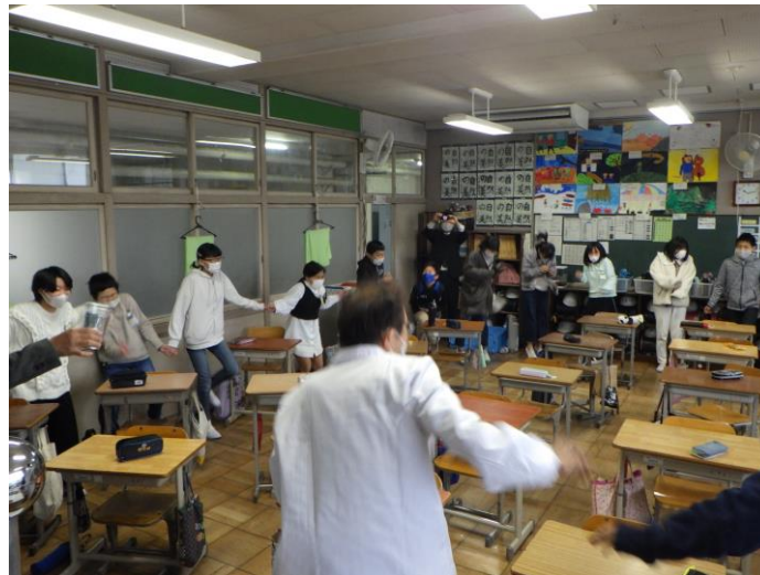
百人おどし(先生・児童・見学者が輪になって)