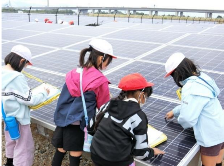
木曾岬小学校3年生 木曾岬メガソーラー見学 (バス社会見学)