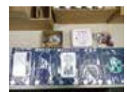
電気の利用 黒板実験セット